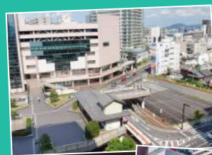
再開発の仮設店舗やショールームがあった時代もありました。

昨年12月から開催している第4日曜のマルシェは「ニワタス」の知名度を上げ、ファンが着実に増えています。出店者もバラエティに富んでいるので、ゆっくり見てまわるだけでも楽しいですね。7月25日(土)・26日(日)にはイベント盛りだくさんのニワタス1周年祭が開催されますよ!