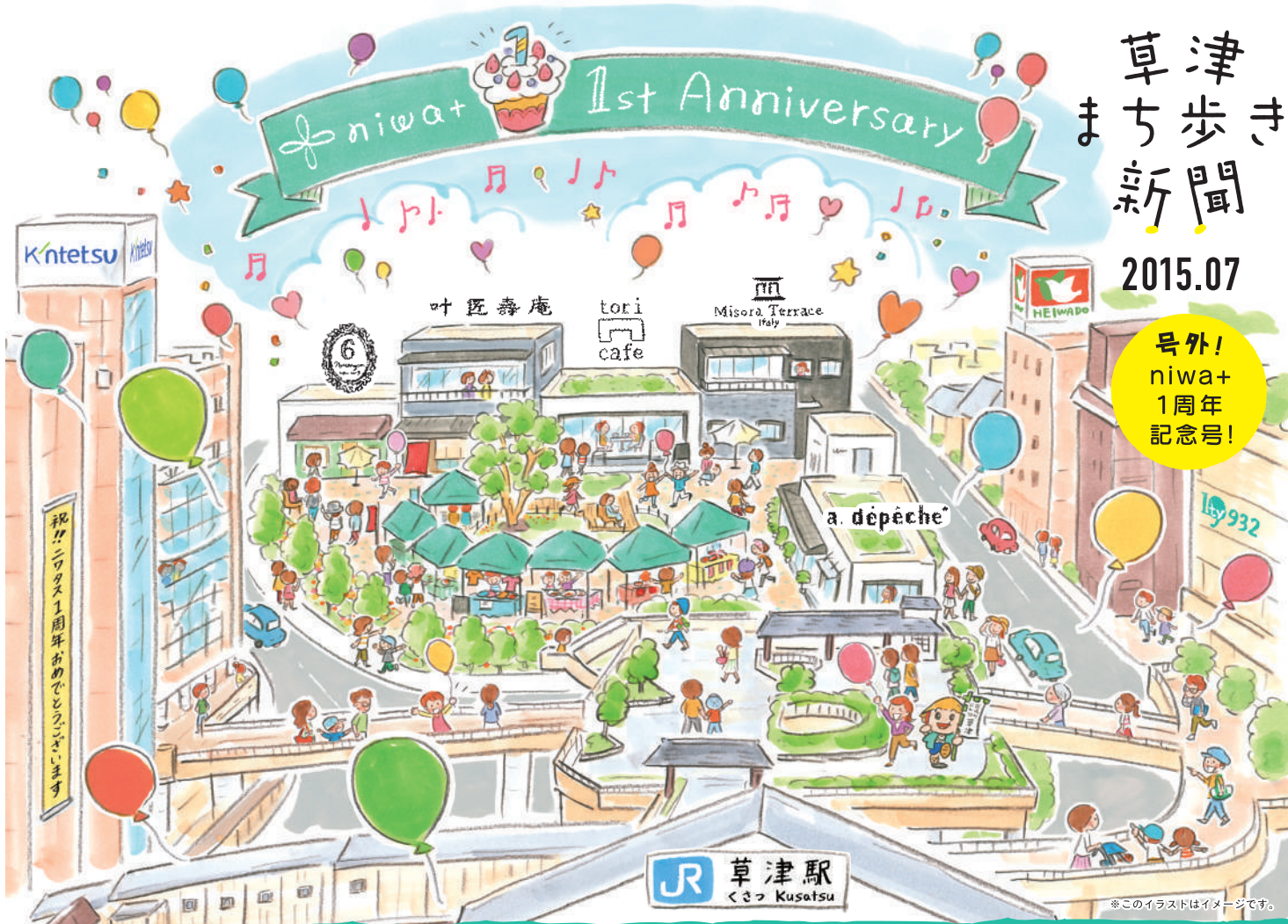
※このイラストはイメージです。