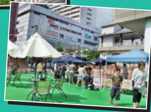
5年程前には空地で月一回、人工芝を敷いて「アート市」を開催していました。