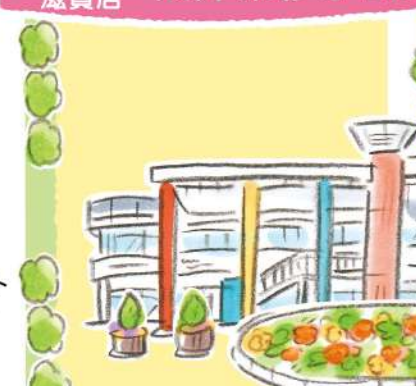
西大路 笠ノ庄 児童遊園