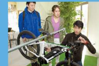
E-BIKEの航続時間は従来の5倍の約100時間！ピワイチにも使えます！