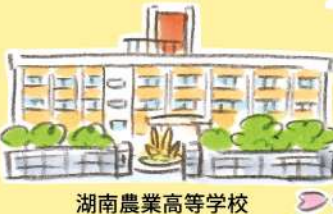
湖南農業高等学校